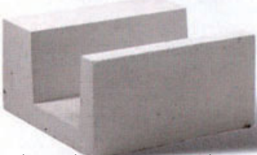
СКАЧАТЬ ПРАЙС-ЛИСТ ГОСТ 31800-2012 ГОСТ 31800-2012