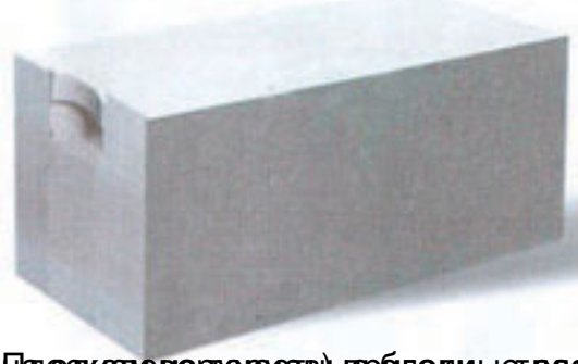
Пазовые блоки с технологическим пазом и выемкой для укладки раствора. Пазовые блоки (с выемкой для укладки раствора)