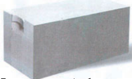
Пазовые блоки – блоки с технологическими пазом и выемкой (в жаровнях кладки)