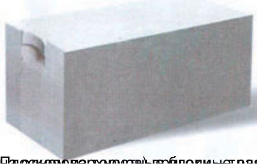
Полукруглые блоки – это блоки с арочными элементами (в жарких странах кладутся на раствор)