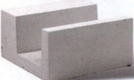
СКАЧАТЬ ПРАЙС-ЛИСТ ГОСТ 31800-2012 ГОСТ 31801-2012