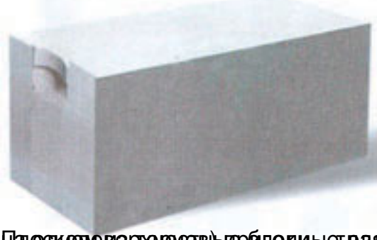
Полнотелые блоки с пазом и выступом – это блоки, которые используются в кладке