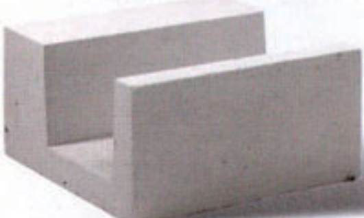
СКАЧАТЬ ПРАЙС-ЛИСТ ГОСТ 31800-2013 ГОСТ 31801-2013