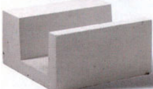
СКАЧАТЬ ЦЕНОВОЙ СПИСОК