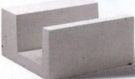
СКАЧАТЬ ПРАЙС-ЛИСТ ГОСТ 31800-2012 ГОСТ 31801-2012