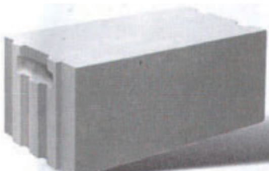
Блоки с технологическими пазом и выемкой для шпателя