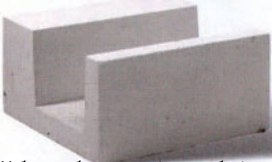
СКАЧАТЬ ПРАЙС-ЛИСТ ГОСТ 31800-2012 ГОСТ 31801-2012