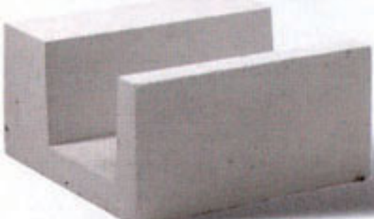
СКАЧАТЬ ПРАЙС-ЛИСТ ГОСТ 31800-2012 ГОСТ 31801-2012